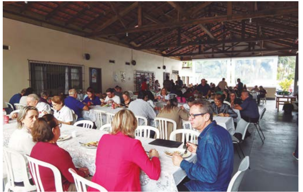
O almoço foi um momento especial de comunhão e integração entre todos os presentes