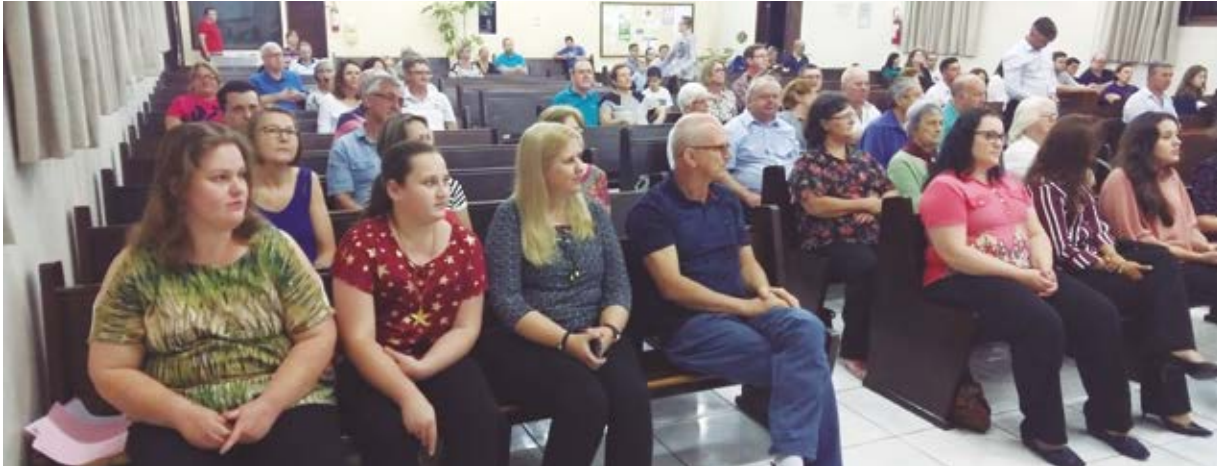
Os presentes ao Festival puderam apreciar a execução de 21 hinos

Na noite de 29 de setembro, a Comunidade São Lucas realizou o 28º Festival de Música Evangélica (FEME), com o tema “Rompendo em Fé”. Cento e vinte pessoas participaram deste culto especial de adoração e gratidão a Deus, inclusive visitantes. O FEME acontece anualmente, com a finalidade de reunir os grupos de louvor, coral e famílias para dirigirem o louvor num culto de adoração ao Senhor e é um momento de grande alegria e comunhão.