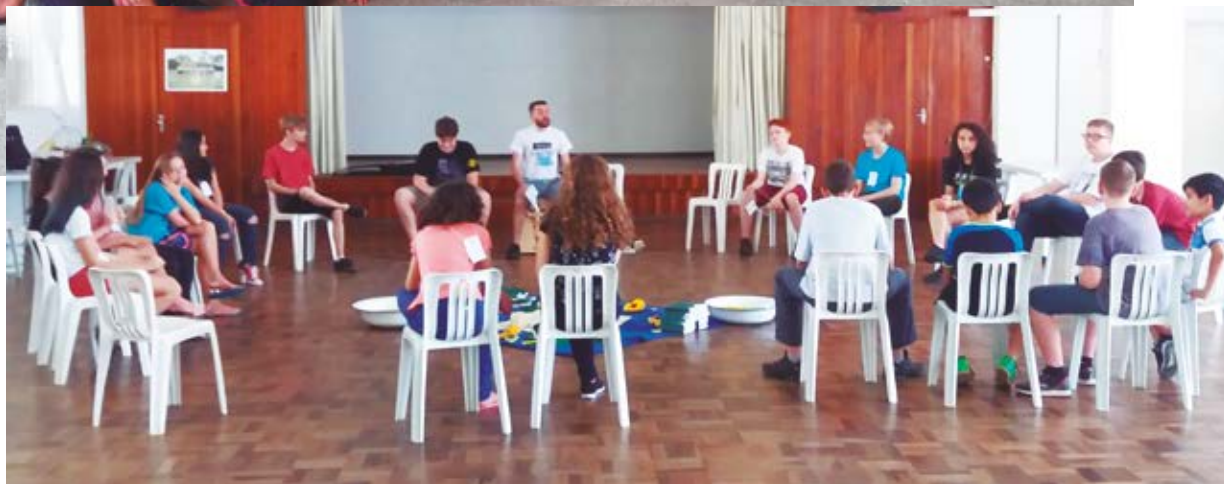
O Acampadentro proporcionou momentos de integração, reflexão e comunhão