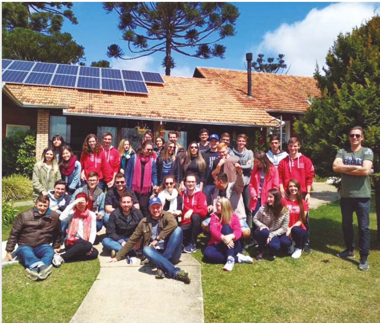
Jovens participaram de momentos de reflexão, meditação, comunhão e descontração