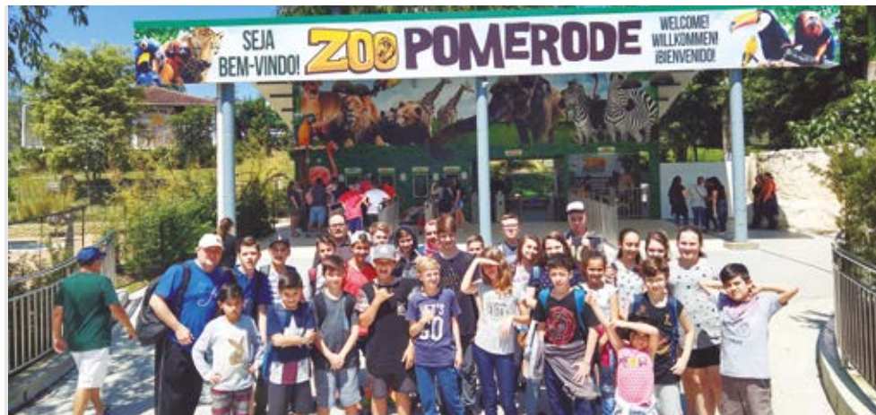
Adolescentes e familiares foram conhecer o Zoológico de Pomerode