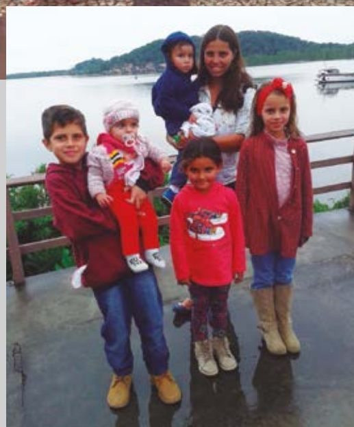
Encontro foi de muita alegria para equipe da Diaconia e famílias assistidas