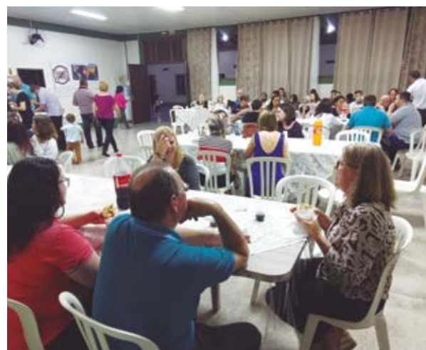
A noite terminou em clima de descontração, com refrigerantes e cachorro-quente

Nosso Deus é maravilhoso! Não podemos deixar nossa fé diminuir nos deixando crer que Ele não tem poder ou amor, ou que Seus planos não estão acontecendo conforme Sua vontade. Porque, em breve, Jesus voltará em poder e glória e veremos algo maravilhoso: o Reino de Deus em poder e glória, sem a presença do pecado, do mal e da morte. Aleluia!