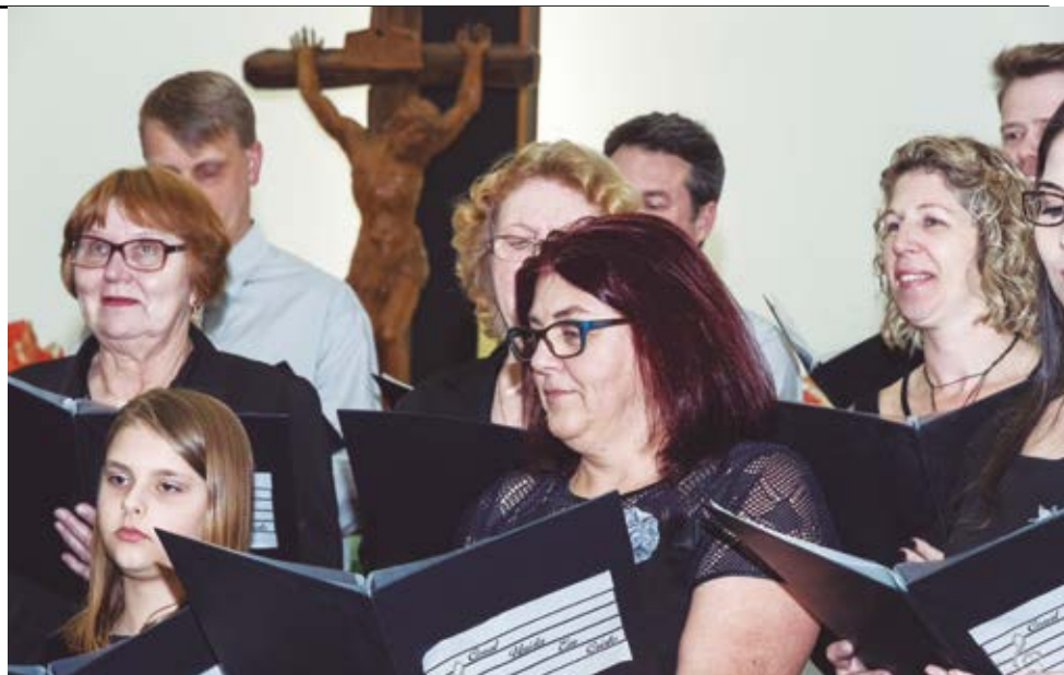
Cada coro apresentou duas músicas sacras de diversos ritmos

“Deus ama toda a humanidade. Porque Deus nos amou primeiro, somos, por nossa vez, capazes de amar e respeitar a dignidade de cada pessoa. O pensamento e a ação diaconais se dirigem, sobretudo, para aquelas pessoas cuja dignidade sofreu ofensa. Para isso se pressupõe uma base espiritual alicerçada sobre a obra de Deus e o servir de Cristo. A igreja, portanto, tem o mandato de dar testemunho a toda a humanidade do amor de Deus para com o mundo em Jesus Cristo. A atividade diaconal é uma das formas desse testemunho.” Fonte: DIAKONIA CHARTER da Federação Europeia de Diaconia, 2000.