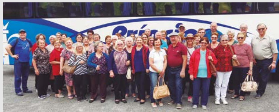
O passeio reuniu 44 idosos do Grupo da Terceira Idade da Comunidade S. Lucas

as futuras gerações a fé e o amor a Deus. Assim esperamos que os idosos da Paróquia São Lucas estejam trabalhando ativamente no testemunho de sua fé aos seus familiares e amigos, experimentando a presença do Senhor em suas vidas e a comunhão com os irmãos. Foi um dia maravilhoso!