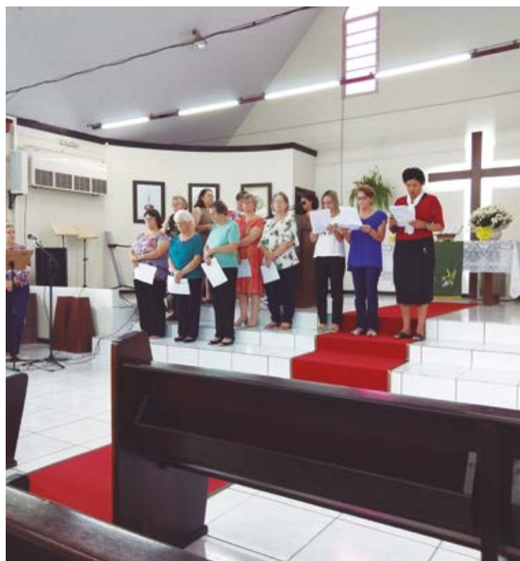
A celebração das OASEs teve como tema “Deus me chama e sou grata”

O culto terminou com o hino “Somos mulheres da OASE”, que apresenta o sentido de fazer parte da OASE. Não podia ficar de fora o convite para as mulheres que estavam no culto, para que participem da OASE, que é um lugar divertido, emocionante e edificante. Esperamos que o grupo cresça!