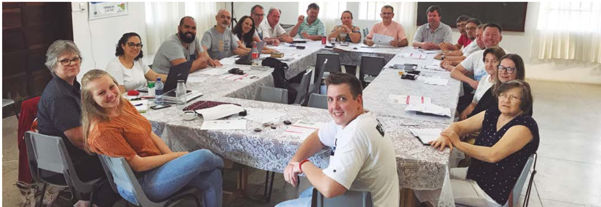
Diretoria, Conselho e líderes de grupo participaram da reunião para avaliação e planejamento para o próximo ano