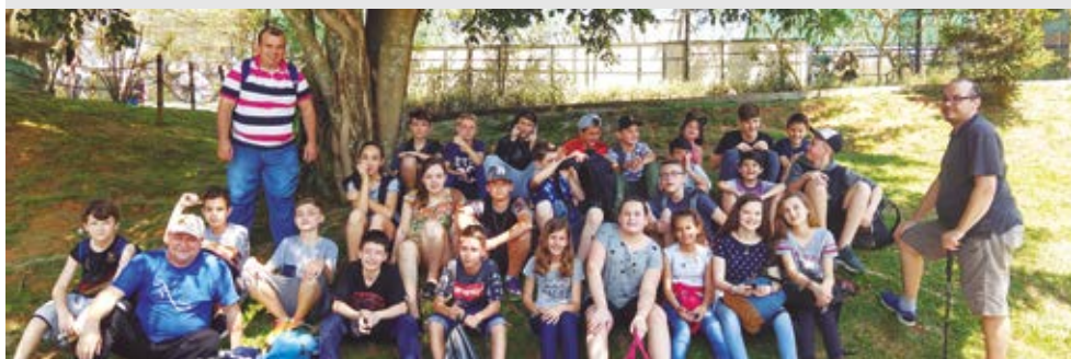
O dia foi recheado de muita comunhão, reflexão e diversão

Aproveitamos para pedir ajuda aos irmãos luteranos de nossa Comunidade Evangélica de Joinville a nos ajudar doando vidros de conserva, de todos os tamanhos. Com isto, estamos ajudando no investimento de material para o trabalho. Quem tiver vidros de conserva pode levar até a secretaria da sua paróquia e nós pegamos lá. Ou buscamos diretamente na sua casa. É só ligar ou enviar uma mensagem de Whatsapp para o celular 98433-0651. Muito obrigado!