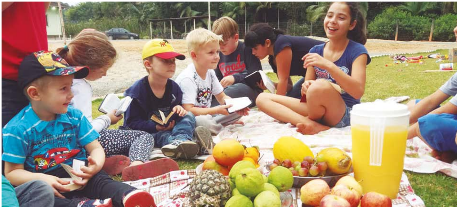
Dinâmica utilizou frutas para ensinar sobre o “fruto do Espírito” para as crianças do culto infantil

Maçã: Representa o amor de Deus “doce” por nós. É uma parte