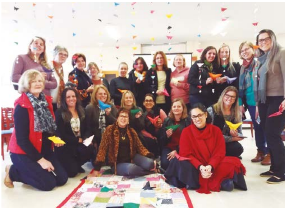
Secretárias participaram de uma reflexão sobre a metamorfose das borboletas