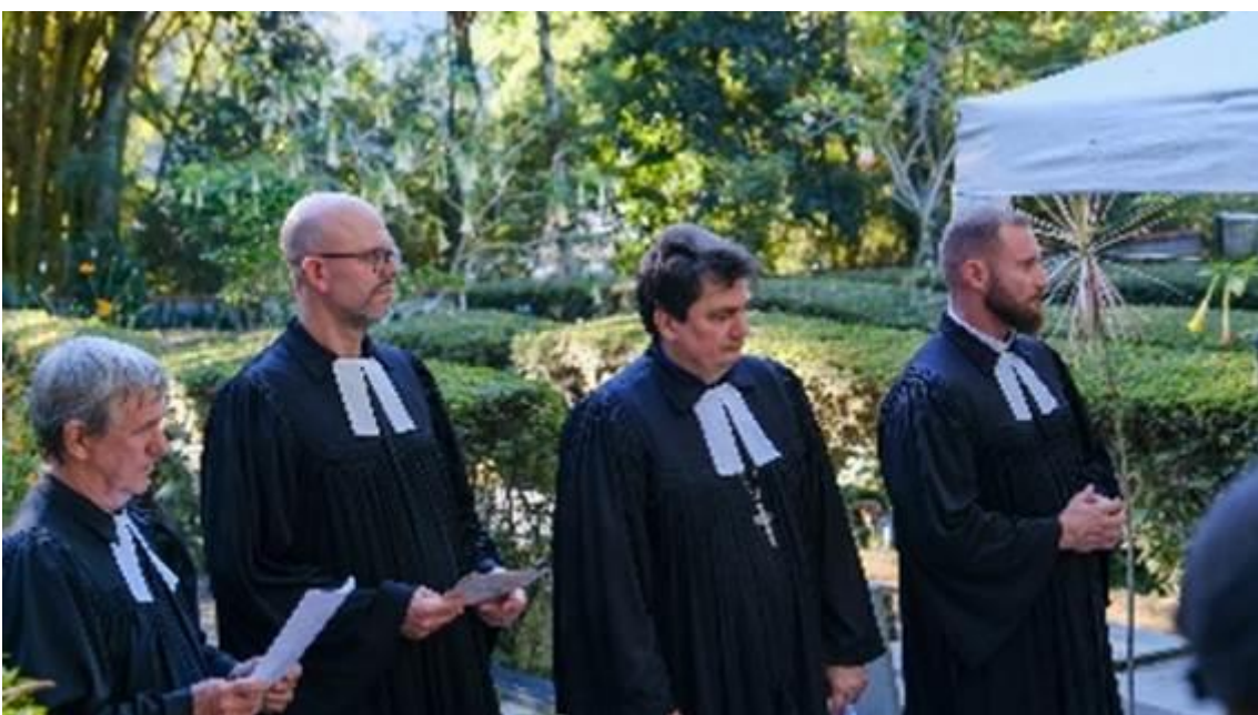
Hino Deus é Castelo Forte, entoado por ocasião da dedicação do busto de Catarina von Bora: https://youtu.be/yWd1_zUheZI