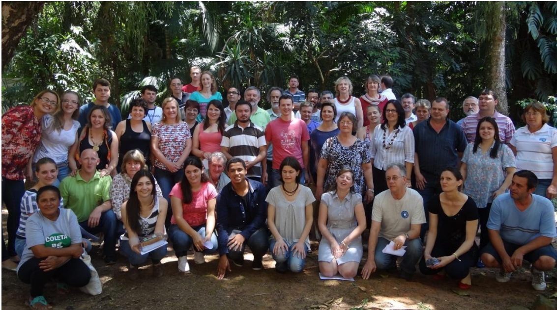
Participantes do Seminário