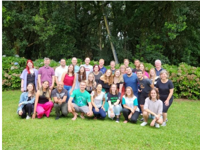
Conselho Nacional da Juventude Evangélica (CONAJE)

Em carta divulgada após a reunião, o CONAJE afirma: “A essência do ser Juventude Evangélica é sonhar a mudança ao mesmo tempo que dá continuidade ao trabalho realizado até então. É colocar seus dons a serviço, perfumando o mundo com o ser JE. Sabendo dos desafios que teremos, saímos desse encontro comprometidos, comprometidas, motivados e motivadas, para buscar recursos financeiros e humanos na preparação das caravanas com destino a Domingos Martins – ES. Assim seguimos no testemunho do amor de Deus, nesse mundo que tanto precisa de amor e cuidado, pois como JE nos colocamos em movimento para espalharmos a essência do perfume de Deus e a luz de Cristo, e sermos sal da terra.”