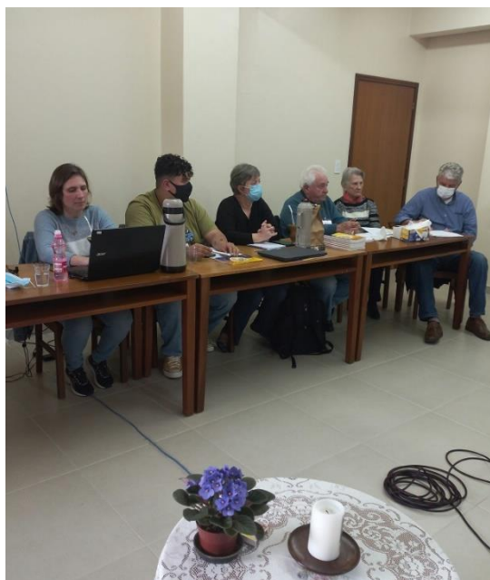
Seminário da OGA em 2022

O Seminário de Formação de representantes sinodais da OGA será quinta-feira, 20 de julho. Mais adiante, comunicaremos detalhes sobre este evento. Já a Assembleia Ordinária da OGA será na sexta-feira, 21 de julho. Igualmente, mais adiante enviaremos informações adicionais. Por enquanto, convidamos representantes sinodais a reservarem essas duas datas em suas agendas.