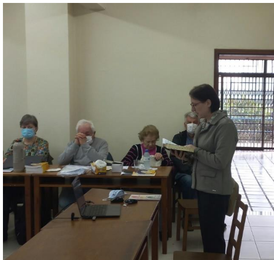
Assembleia da OGA em 2022

O Seminário de Formação de representantes sinodais da OGA será quinta-feira, 20 de julho. Mais adiante, comunicaremos detalhes sobre este evento. Já a Assembleia Ordinária da OGA será na sexta-feira, 21 de julho. Igualmente, mais adiante enviaremos informações adicionais. Por enquanto, convidamos representantes sinodais a reservarem essas duas datas em suas agendas.