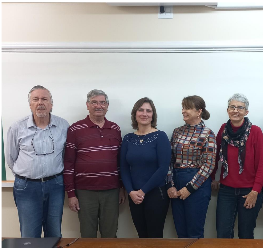
Diretoria da OGA