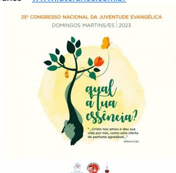
Cartaz do 25º CONGRENAGE