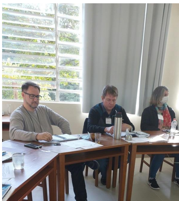
Participantes na XIV Assembleia Geral Ordinária da OGA