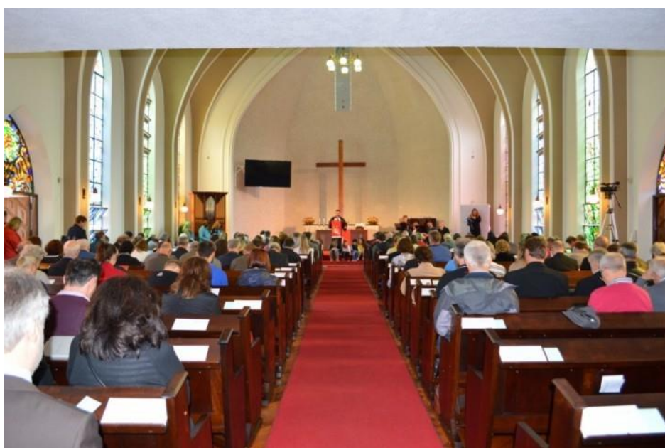
Culto de encerramento do XXXI Concílio da Igreja em Curitiba (PR), em 2018

Olhando para o concílio, desejamos uma assembleia construtiva, com eleições calmas. Que todo o concílio tenha em mente a que veio e que sua finalidade última é servir como Igreja de Jesus Cristo no Brasil.