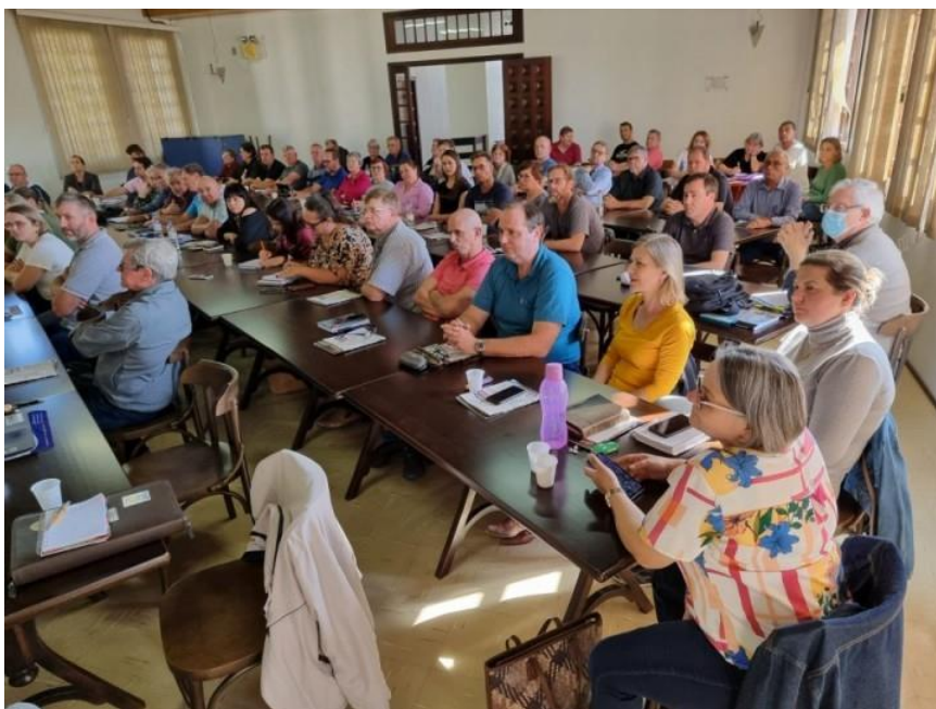
Encontro Sinodal de Presidentes, Tesoureiras e Tesoureiros em São Bento do Sul (SC)