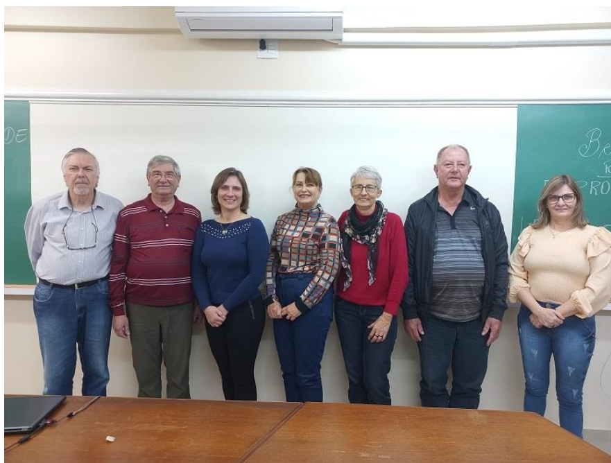
Diretoria da OGA – gestão 2023-2026