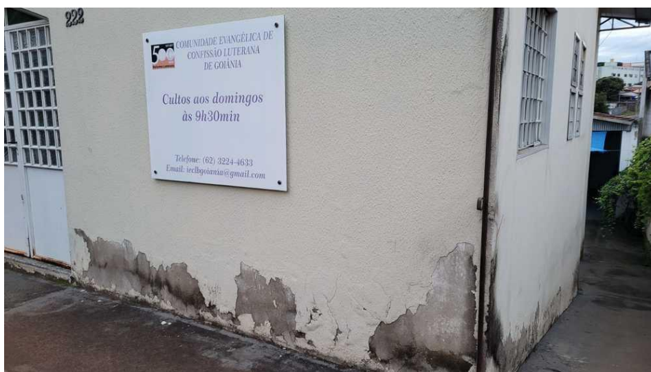
Comunidade de Goiânia - reforma do templo e local de culto infantil