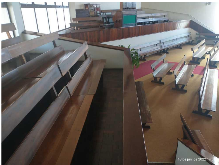
Comunidade de Canoinhas – adequação de segurança junto aos bombeiros