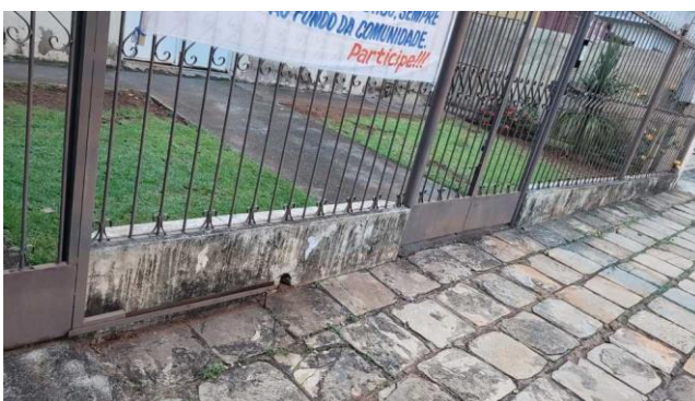
Situação precária do templo em Goiânia