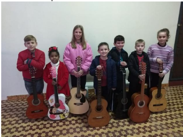
ALUNOS DA OFICINA DE VIOLÃO em apresentação no culto na Comunidade Paz em 2017

Desde março de 2012 a Comunidade desenvolve um trabalho na área da música e canto junto a crianças e jovens. Além de canto coral, há aulas em instrumentos musicais: flauta, teclado, piano, violão, acordeão. São atendidas mais de 100 crianças. Com o auxílio da Ação Confirmandos puderam ser adquiridos novos instrumentos para a continuidade do trabalho.