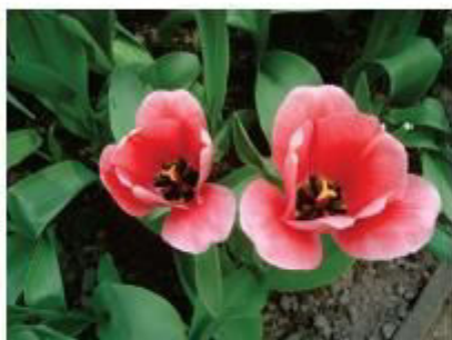
É primavera na Alemanha!