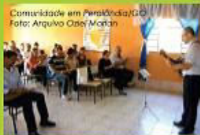
Comunidade em Parokiânia/GO