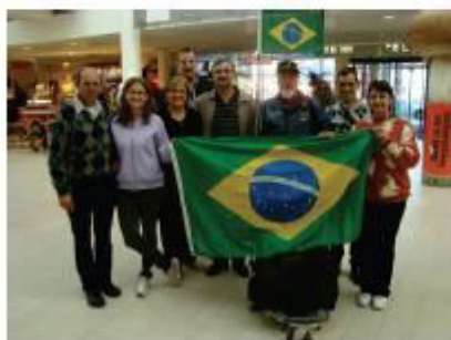
Recepção na chegada do aeroporto de Bremen.

O tema da visita foi formação de lideranças, educação e serviço voluntário. Os membros das comunidades foram os hospedeiros. A delegação tomou parte de uma variada e intensa programação: cultos, encontro sobre a formação de lideranças, participação no Dia da Igreja em Hamburgo, visita à escolas, trabalho com deficientes, atividades diaconais e viagem para as principais cidades que fazem parte da história de Martin Lutero: Eisenach (Castelo de Wartburg), Erfurt, Eisleben e Wittenberg.