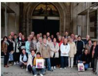
Com pessoas das comunidades de Syke-Hoya em frente à porta da Igreja de Wittenberg onde Lutero pregou as 95 teses.