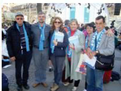
Em Hamburgo, momentos antes do culto de abertura do Dia da Igreja.