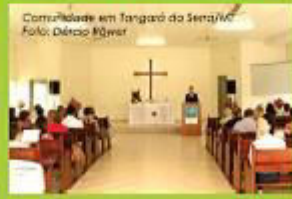
Comunidade em Tangará do Norte/MT