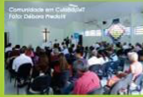
Comunidade em Cuiabá/MT