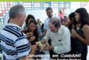
Comunidade em Cuiabá/MT