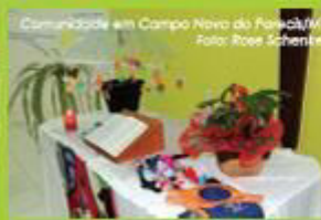
Comunidade em Campo Novo do Pareá/MT