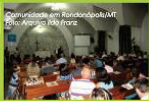
Comunidade em Rondópolis/MT