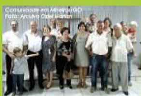
Comunidade em Alameda/GO