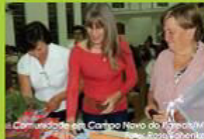
Comunidade em Campo Novo do Pareá/MT